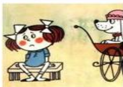
Káťa a Škubánek