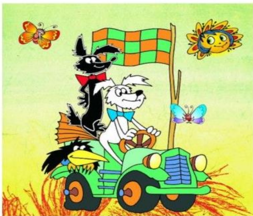
Staflík a Spagetka