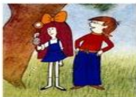
Mach a Šebestová