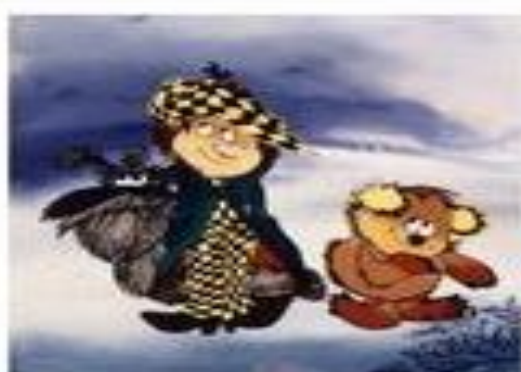
Kubuľa a Kuba Kubíkula