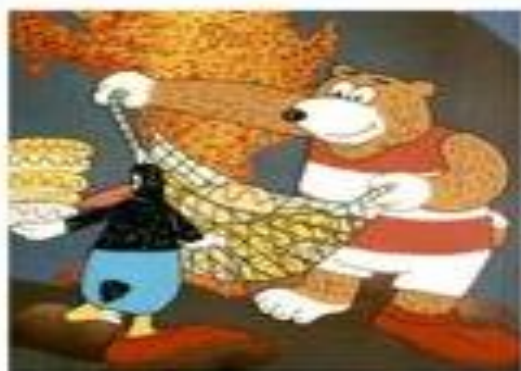
Buga a Páola