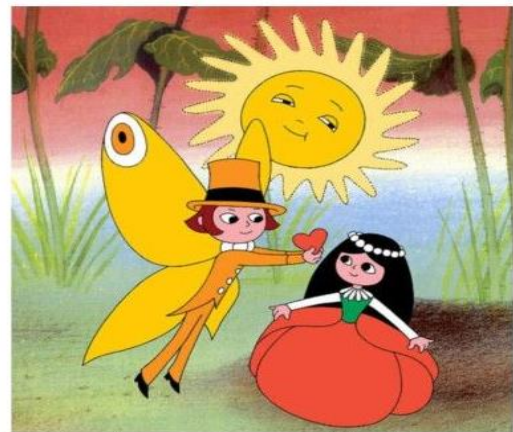
O makové panence a motýlu Emanuelovi