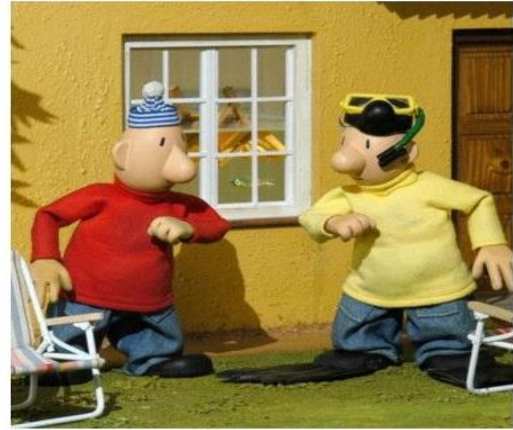
Pat a Mat