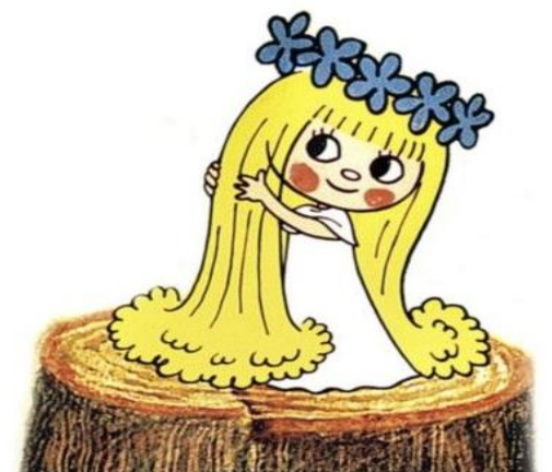
Rikání o vile Amálce