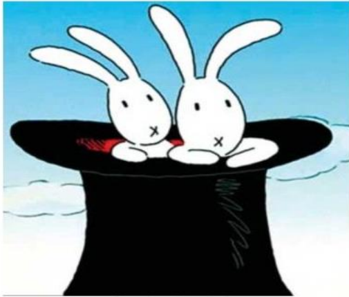
Bob a Bobek