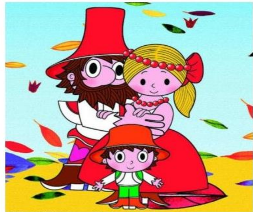
O loupežníku Rumcajsovi