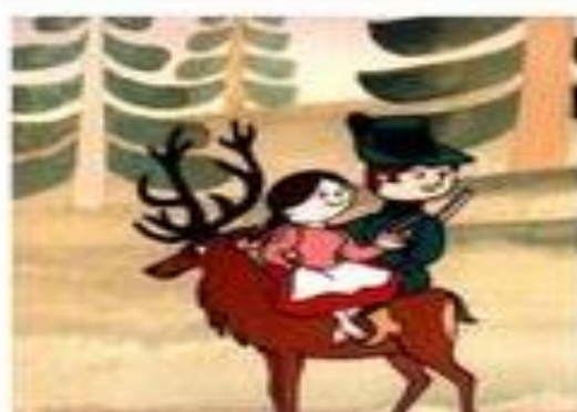
© hajném Robátkovi a jelenu Větrníkovi